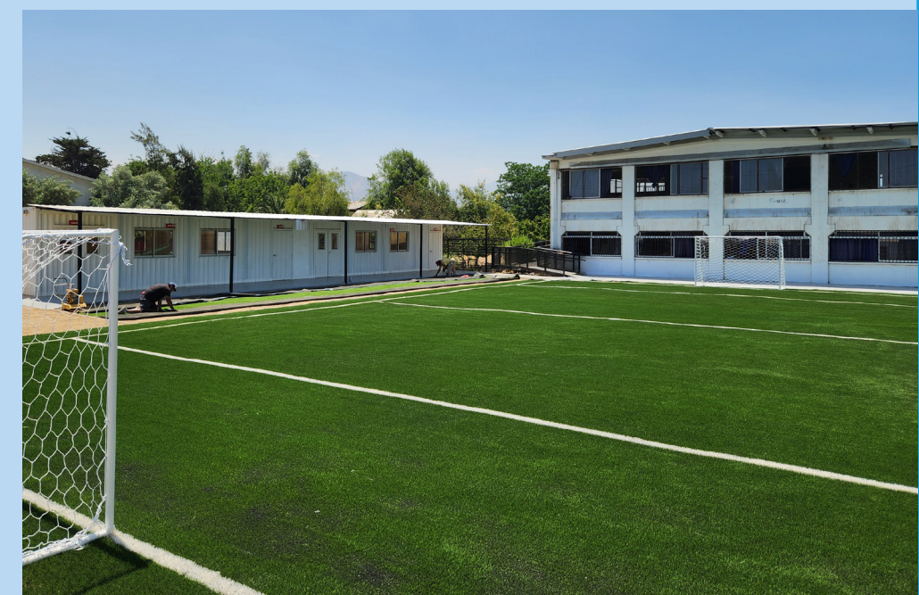
Junto a las nuevas salas modulares, se sumó también una cancha deportiva.