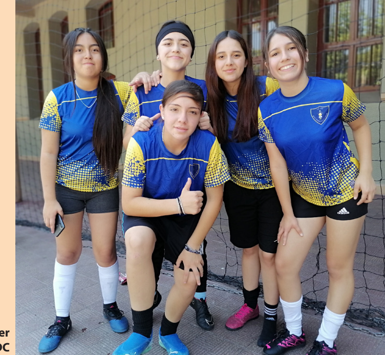
Estudiantes del taller de fútbol, LJDC