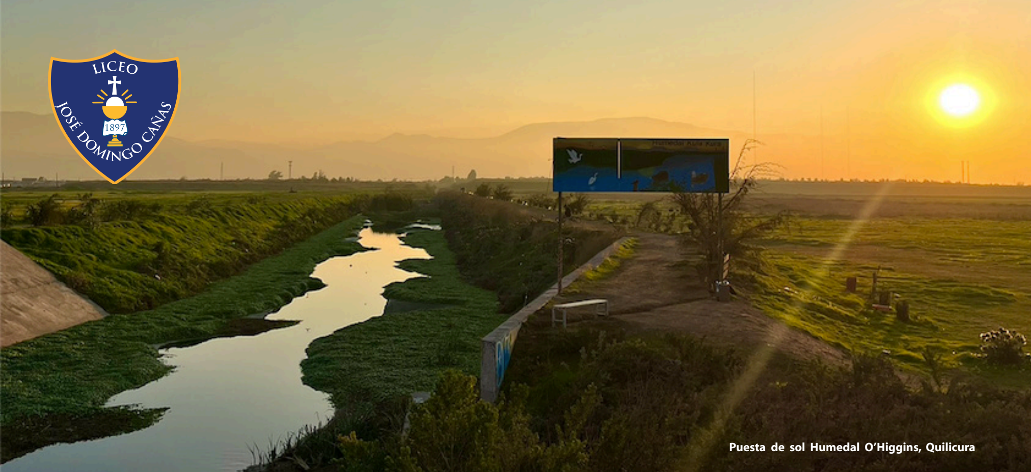
Puesta de sol Humedal O'Higgins, Quilicura