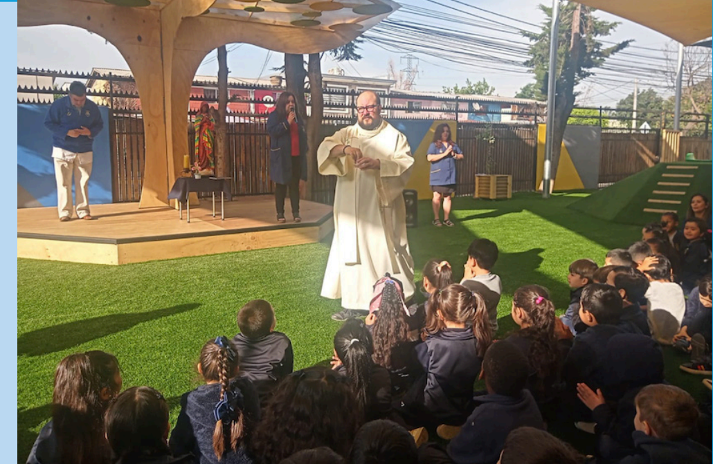
Inauguración y bendición de nuevo patio nivel Parvulario.

Otra mejora en la infraestructura corresponde a las dos salas modulares que se están instalando detrás del casino de profesores, con un innovador modelo constructivo de paneles modulares. La obra está en proceso y tendrá otra etapa en los próximos meses.