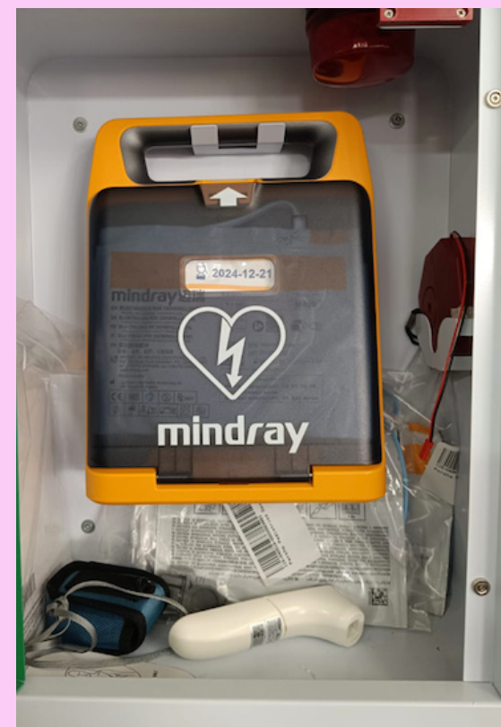
Debemos destacar que en nuestra enfermería es muy importante el DEA (desfibrilador externo automático).