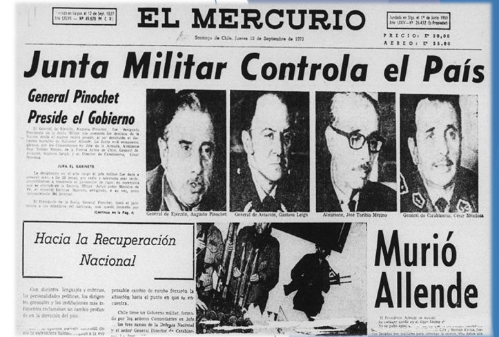
El golpe de Estado de 1973