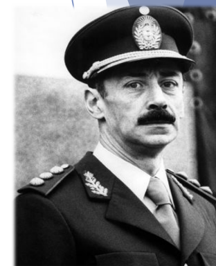
Jorge Rafael Videla