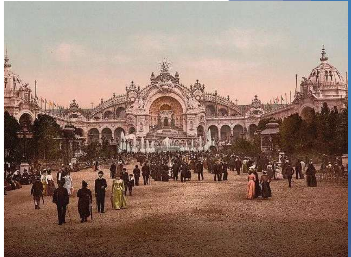
Exposición universal en París, 1900