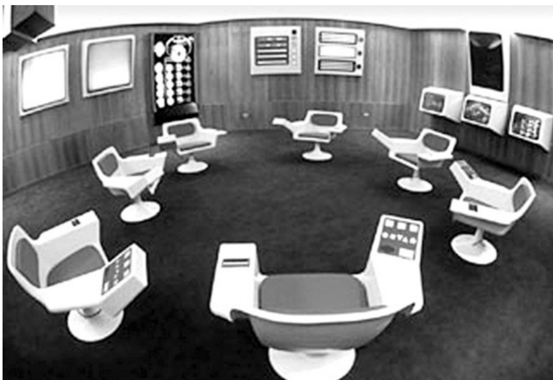
Ops-room de Synco, Santiago de Chile, 1973.