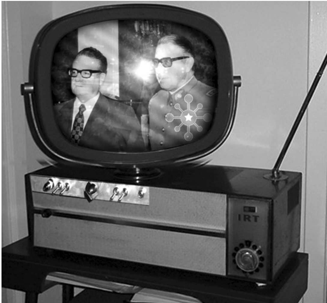
Modelo de televisor estatal con la consola de interacción ciudadana incorporada. Se repartieron cuatro millones de unidades entre los votantes. La consola de interacción permitía emitir votaciones en tiempo real en las discusiones municipales y marcar tendencia frente a los temas propuestos en la Cámara de Diputados. Noviembre de 1976.