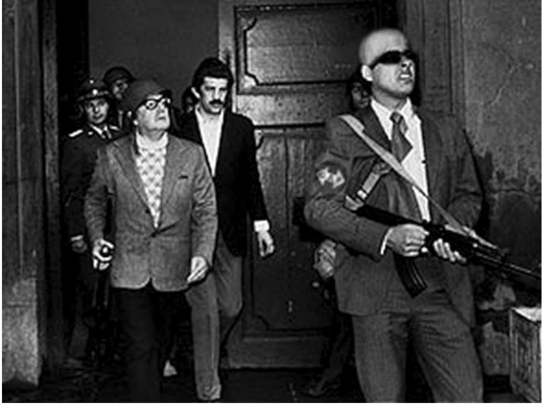
Salvador Allende escoltado por un GAP durante ejercicios de seguridad en La Moneda, mayo de 1977.