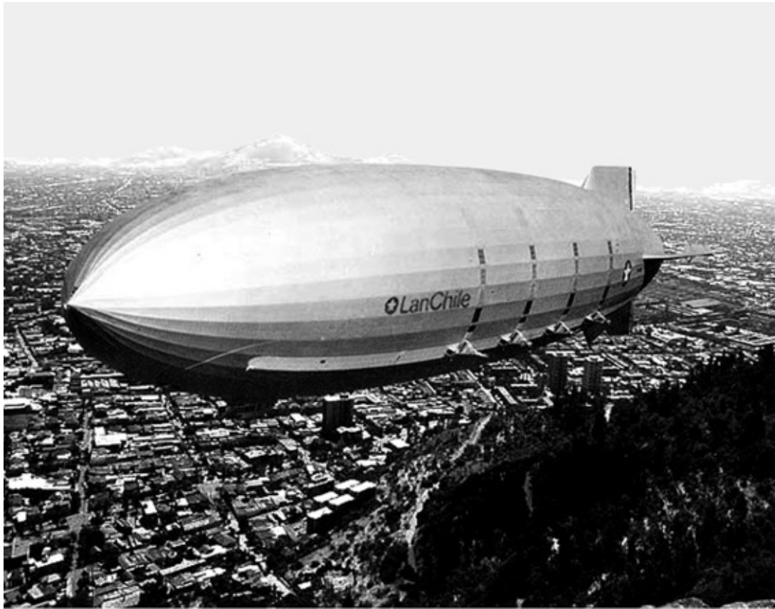
Vista desde el cerro San Cristóbal del Luis Emilio Recabarren, dirigible tripulado de LanChile, evolucionando sobre Santiago en dirección a las estaciones geotermales del desierto de Atacama. Enero de 1978.