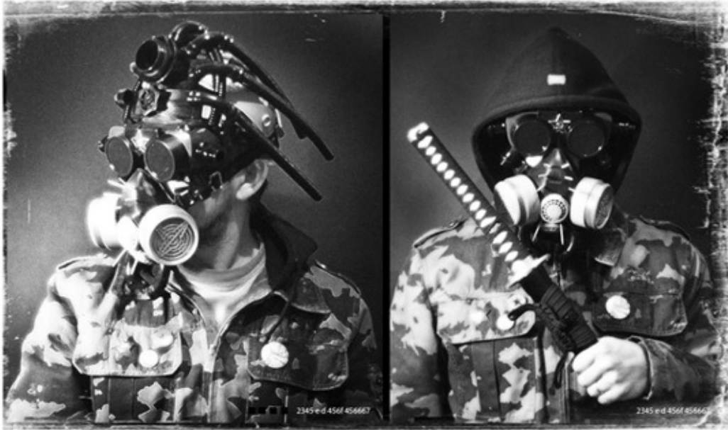
Tira de contacto del único registro conocido del comandante Proxy. Filtrado a la prensa búlgara tras la caída del muro de Berlín. Año 1996.