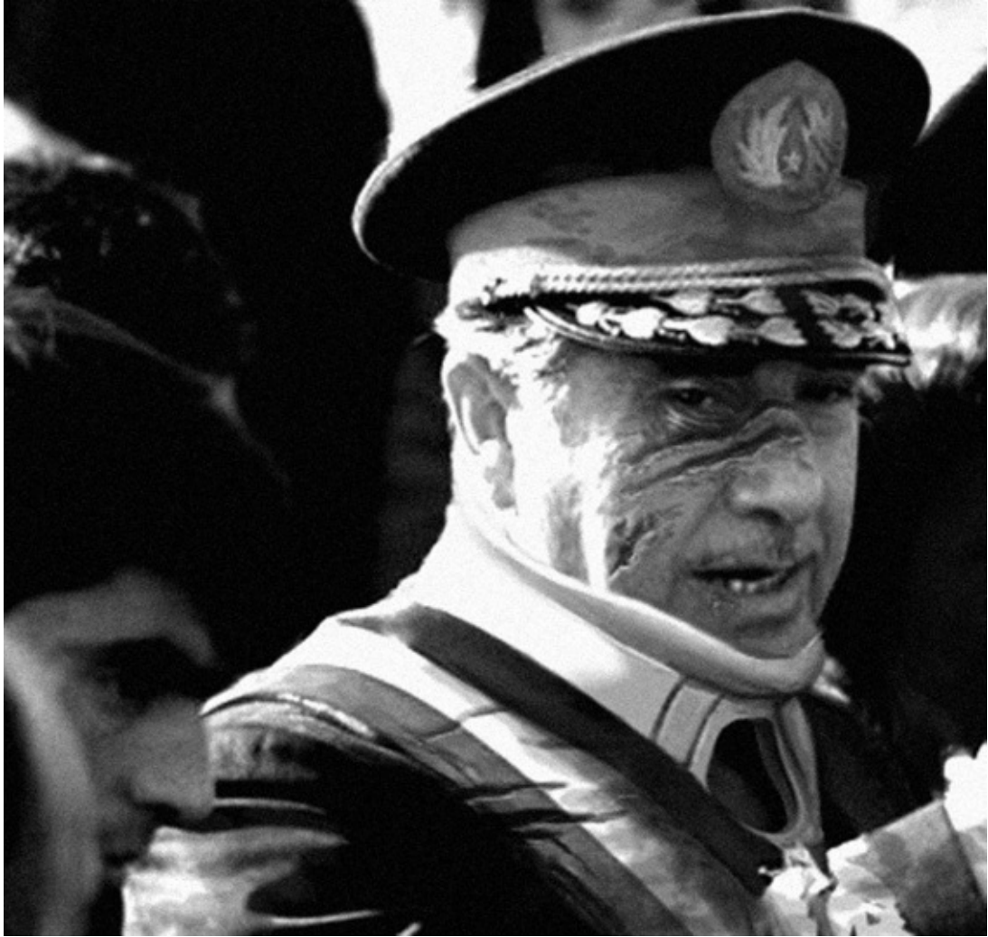
El general Augusto Pinochet Ugarte durante la ceremonia de traspaso del mando de la Comandancia en Jefe del Ejército. Septiembre de 1976.