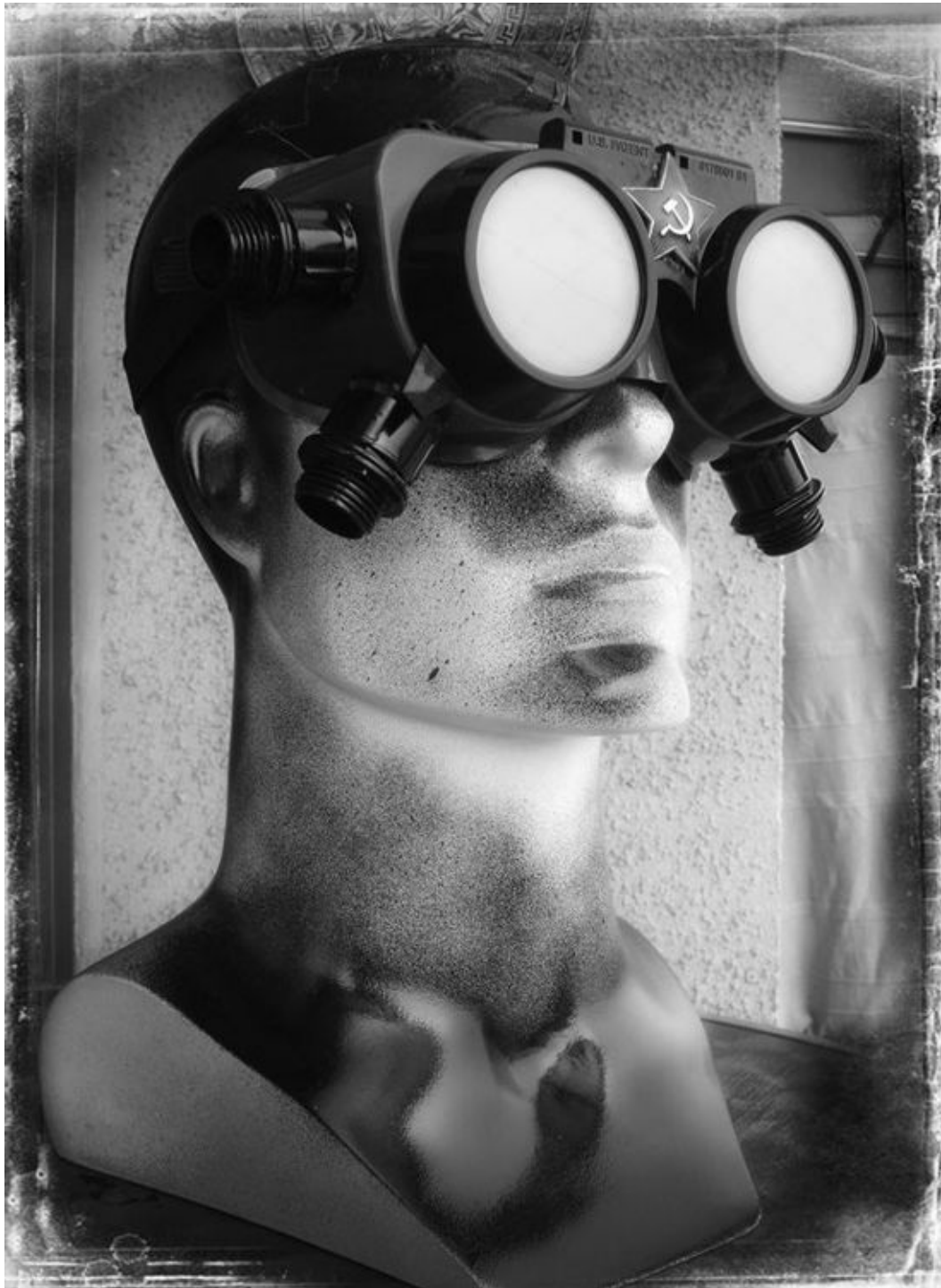
Maqueta del monumento al comandante Proxy, nunca realizado. Fotografía encontrada en una bodega del Ministerio del Interior durante el gobierno de Ricardo Lagos, marzo de 2003.