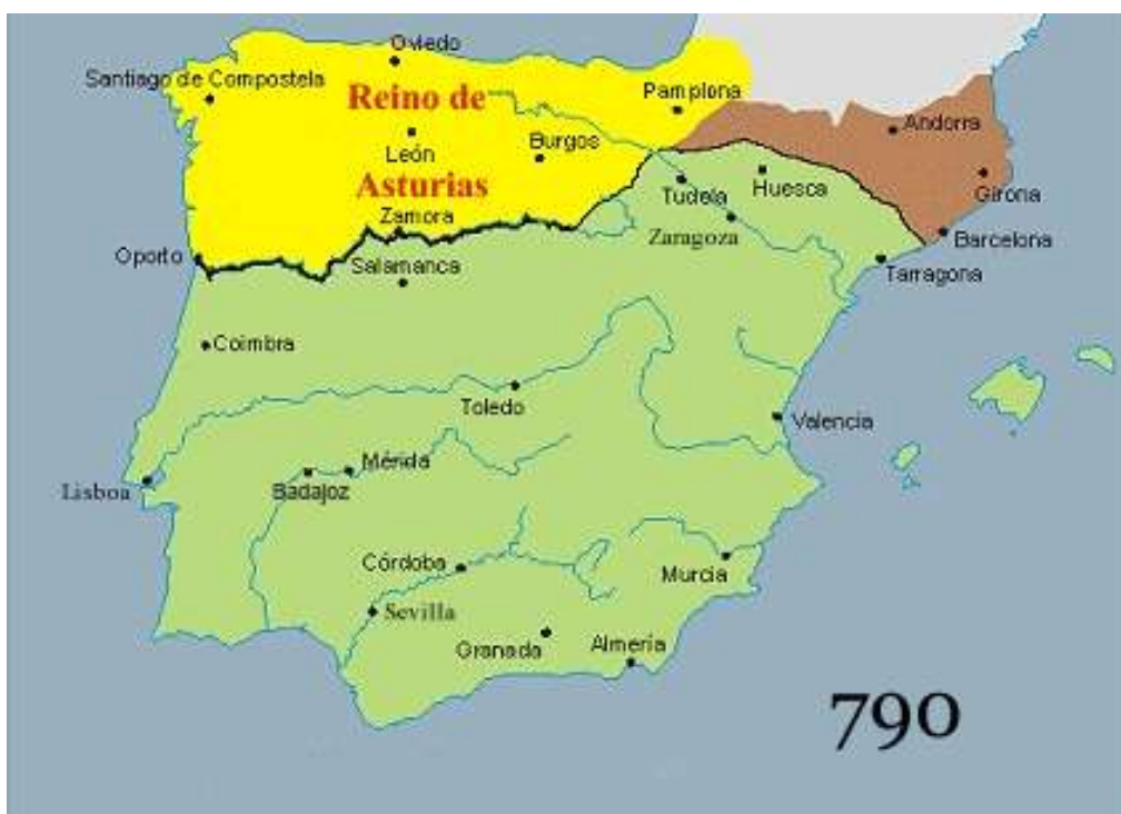
Mapa 1: Califato del Al-Ándalus en el año 790.

III.- Observa los siguientes mapas 1 y 2 de la Península Ibérica. Indaga y escribe en tu cuaderno las ciudades que pertenecieron al Califato de Al-Ándalus y a que municipios y provincias pertenecen en la actualidad.