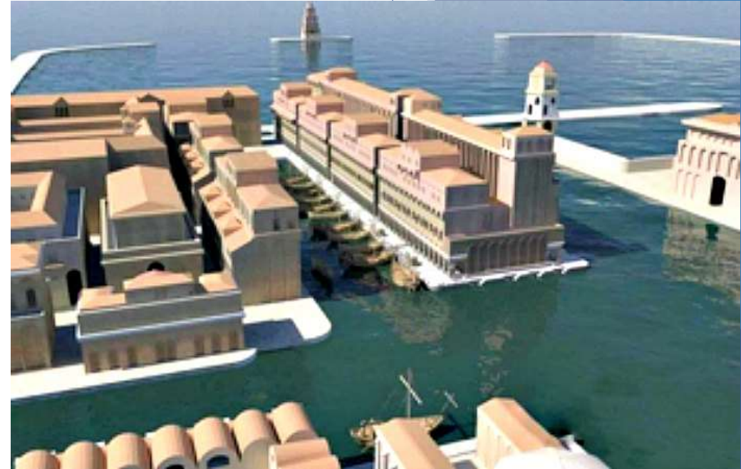
Puerto de Roma.