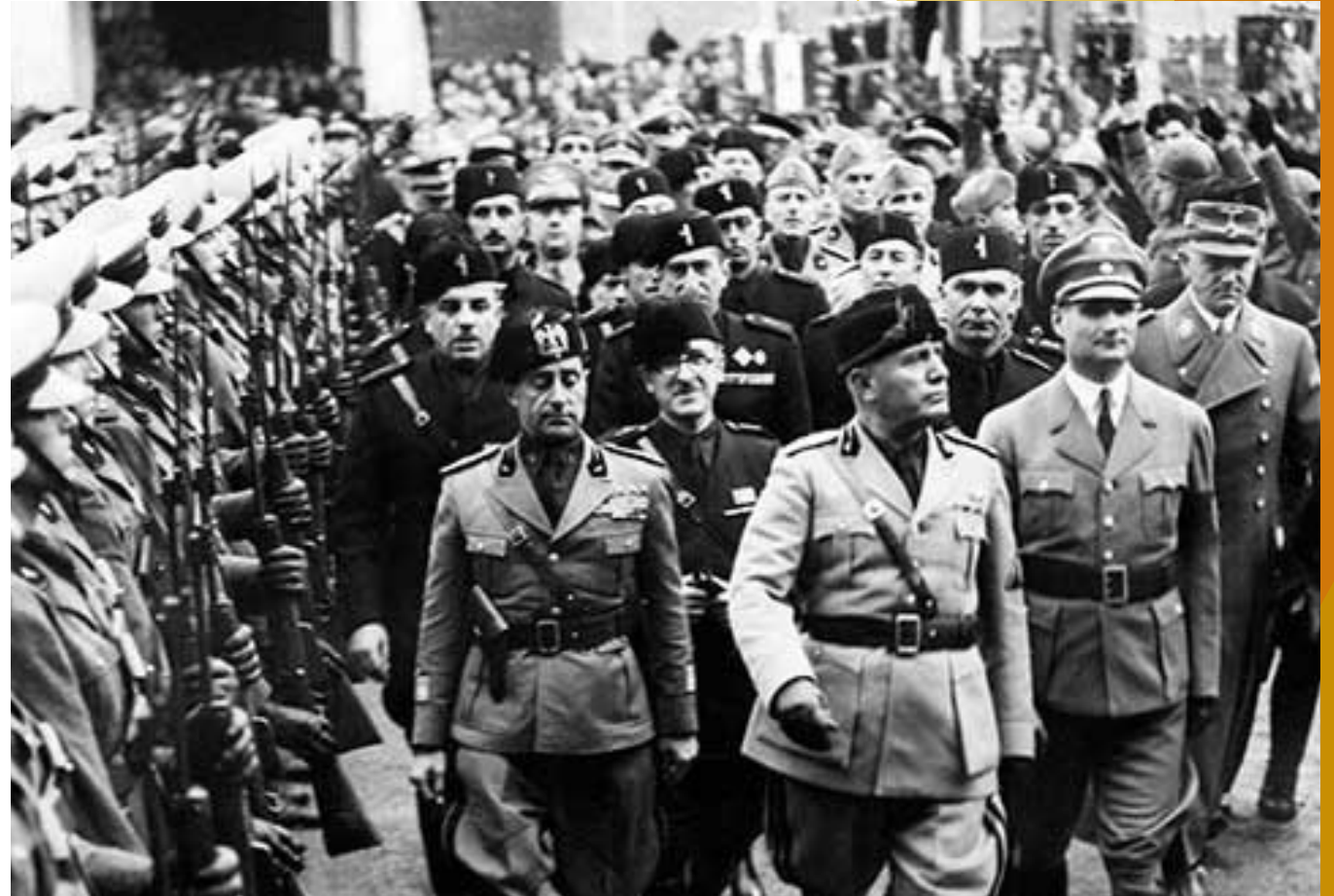
Benito Mussolini. Desfile, Roma 1934.