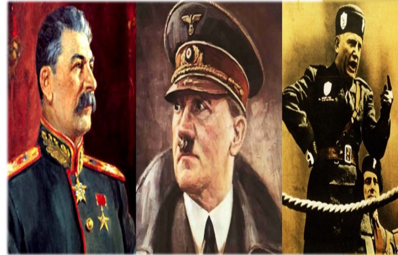
Los líderes de los totalitarismos europeos de Entreguerras