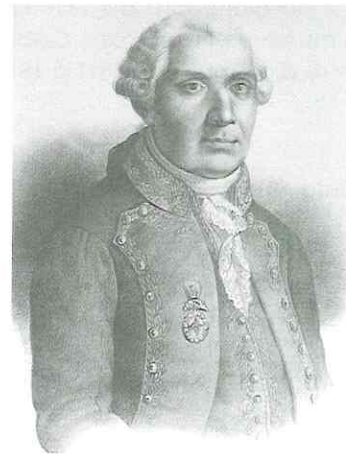
Mateo de Toro y Zambrano