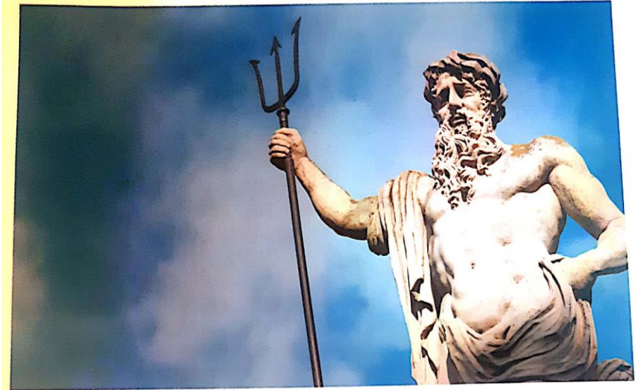
Estatua del dios Neptuno.

Febo: Era el dios de la luz, de la poesía, de la música y de la salud.