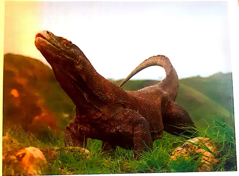
| Dragón de Komodo de dos metros de largo.

Cuando sale a cazar, este gran reptil localiza a su presa y le da un solo mordisco. Como en su saliva hay 82 especies diferentes de bacterias infecciosas, la desafortunada víctima muere en pocas horas. Entonces, con su habitual lentitud, el dragón de Komodo sigue su rastro, la encuentra y se la come.