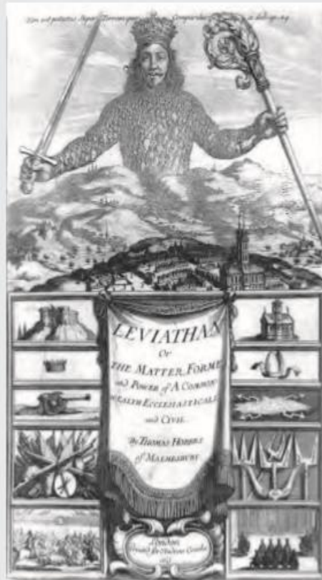
► Portada de la primera edición de Leviatán (Inglaterra, 1651).

Hobbes, T. (1651). Leviatán . Inglaterra. (Adaptación).