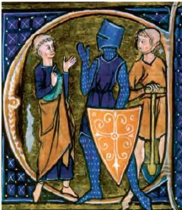
Representación de un clérigo, un campesino y un caballero Ilustración en un manuscrito medieval del siglo XIII.