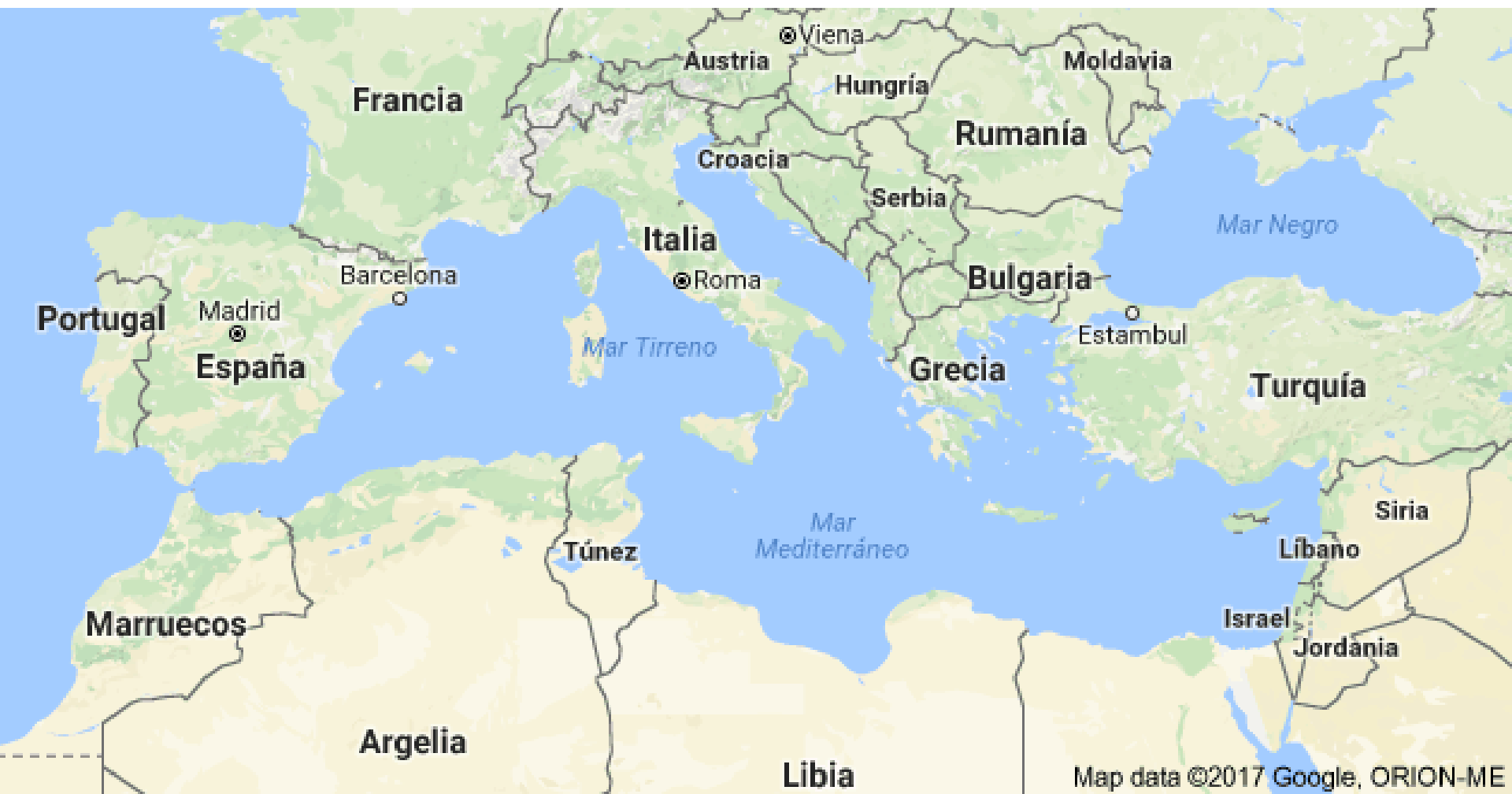
Mapa con los actuales países que rodean el mar Mediterráneo.