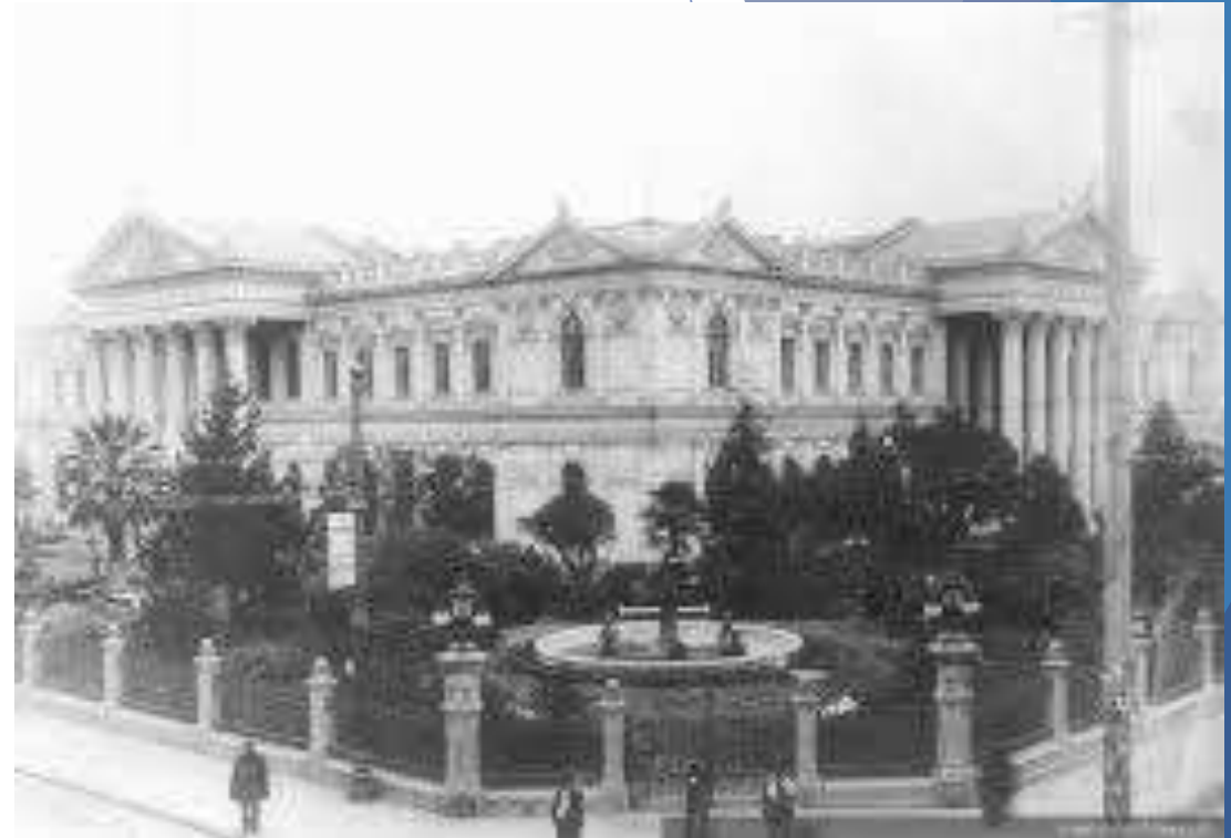
Antigo Congreso nacional en Santiago. 1915