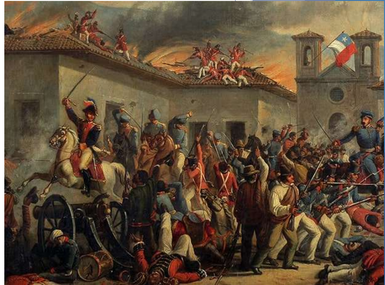
Óleo de la batalla de Rancagua por el pintor Giulio Nanetti.