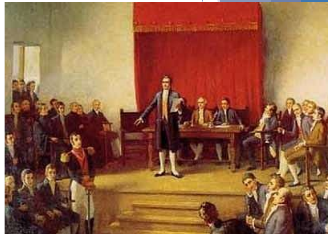
1° Junta Nacional de Gobierno 1810.