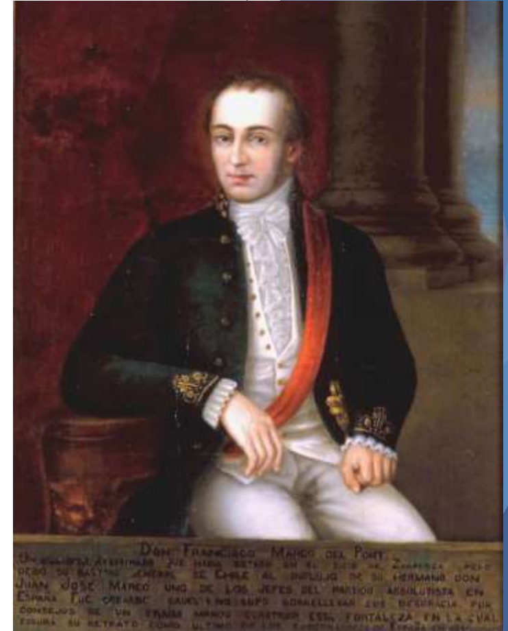
Casimiro Marcó del Pont.