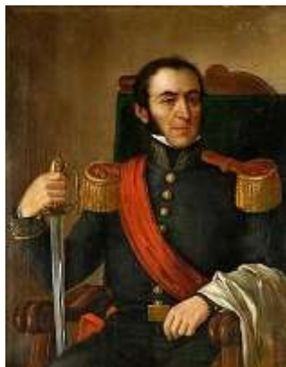
Al mando de Mariano Osorio