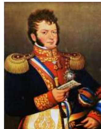
Al mando de José Miguel Carrera y Bernardo O' Higgins