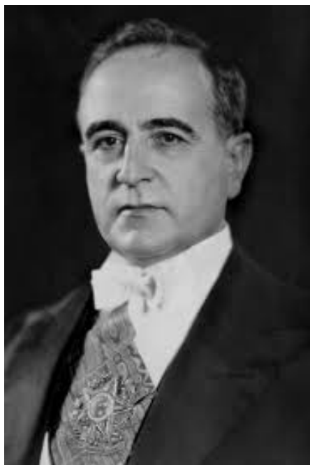
Juan Domingo Perón en Argentina (1946-1955, 1973-1974).