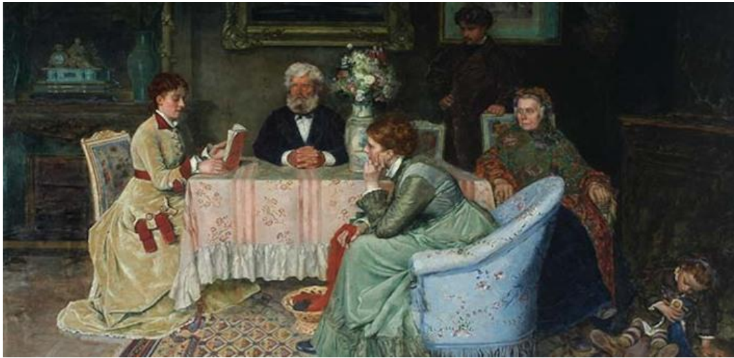
Nombre: La lectura. Autor: Cosme San Martín. Nacionalidad: chilena. Año: 1874. Técnica: óleo sobre tela.