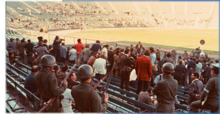
Detenidos en el Estadio Nacional

Además, desde los primeros días del régimen militar, se utilizó el Estadio Nacional y otros recintos, como centros de detenciones masivas de personas a las que se les asociaba con el gobierno de Salvador Allende.