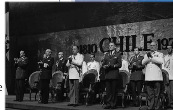
La Junta Militar reunida en el edificio Diego Portales